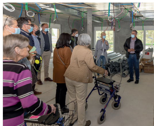
Die gestaffelt durchgeführten Führungen starteten zwischen Kabeln und Rohren in der künftigen Cafeteria.