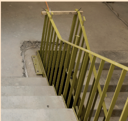
Das bereits montierte grüne Treppengeländer lässt das Farbkonzept erahnen.

Ein Blick in die Entstehung des Farbkonzeptes: Das neue Alterszentrum Breitlen wird mit Naturtönen und Naturmaterialien arbeiten. Als Inspirationsquelle gilt unsere Adresse, die Obstgartenstrasse. So werden künftig Wände und einzelne Elemente in den Farben von Früchten für Farbakzente sorgen: Das saftige Grün von Birnen, das leuchtende Orange von Aprikosen oder auch das gedämpfte Gelb von Quitten helfen, sich im neuen Alterszentrum zurechtzufinden und wohlfühlen.