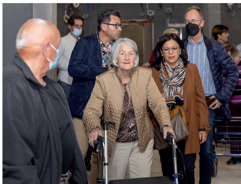
Rund 65 Personen haben sich für den Inforundgang interessiert.