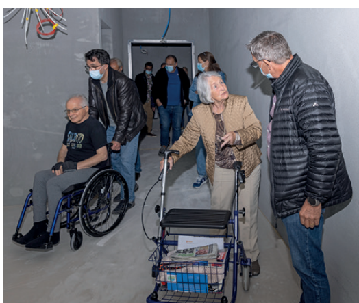
Die 61 neuen Zimmer waren besonders interessant für die Besucherinnen und Besucher. Die Wände waren zwar noch etwas grau. Mit etwas Fantasie liess sich jedoch bereits erahnen, wo künftig das Bett und der Tisch stehen werden.