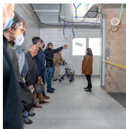
In der Küche wird künftig wieder mit viel Herzblut für das Wohl aller Bewohnerinnen und Bewohner gesorgt.