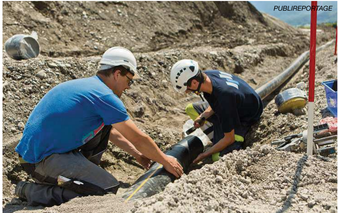
Schutzrohre für die Glasfaserleitungen werden verlegt.